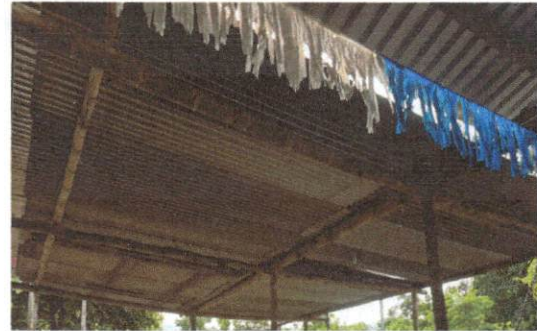
Foto 2: Sustitución de estructura de soporte de madera, por metal